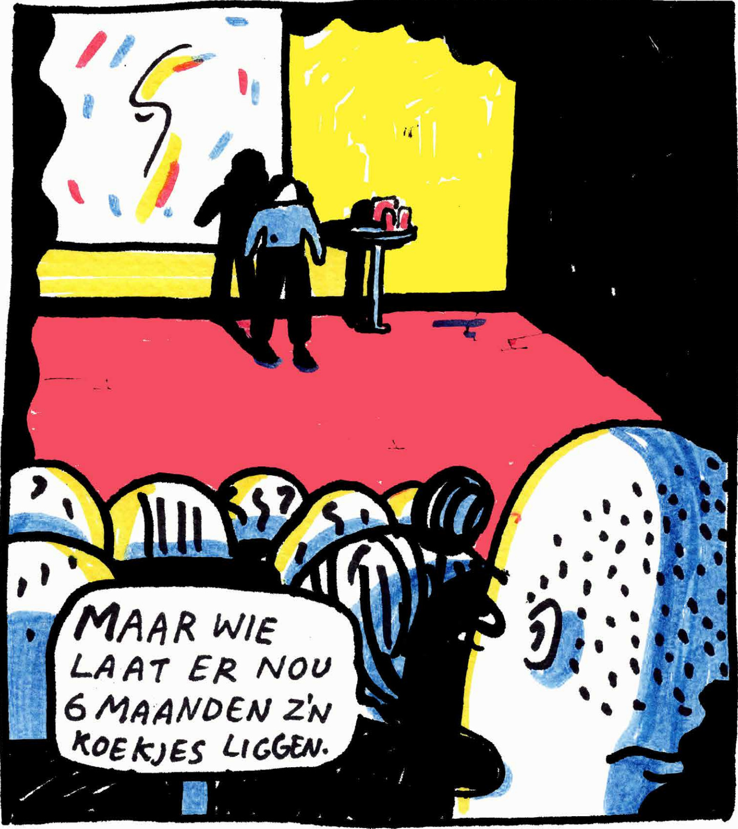
Iemand uit het publiek deelde zijn zorgen.